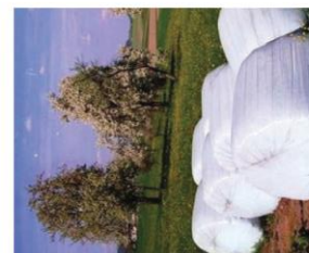
Bezirksabfallverband Perg Tel.: 07262/53134 perg@umweltprofis.at